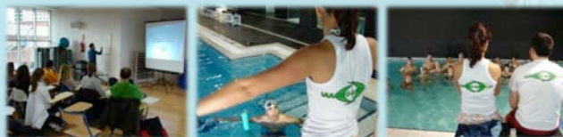
- Contenidos teórico - prácticos (ediciones anteriores) -