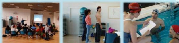
- Contenidos teórico - prácticos (ediciones anteriores) -